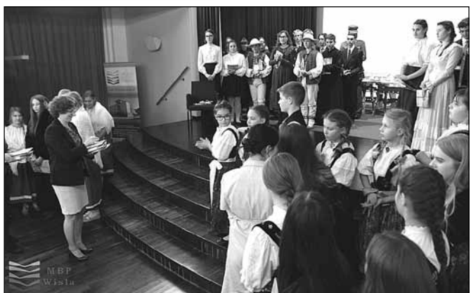
fol. MBP w Wiśle

Dofinansowano ze środków Narodowego Centrum Kultury w ramach programu „Kultura – Interwencje 2018. EtnoPolska”