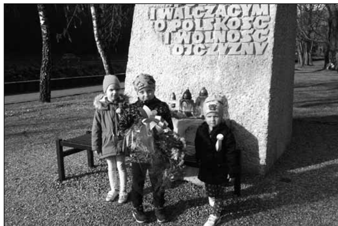
Przedszkole nr 2