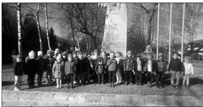
foto. Przedszkole nr 3