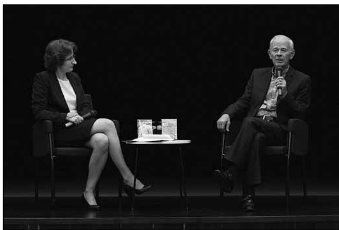
fol. MBP w Wiśle