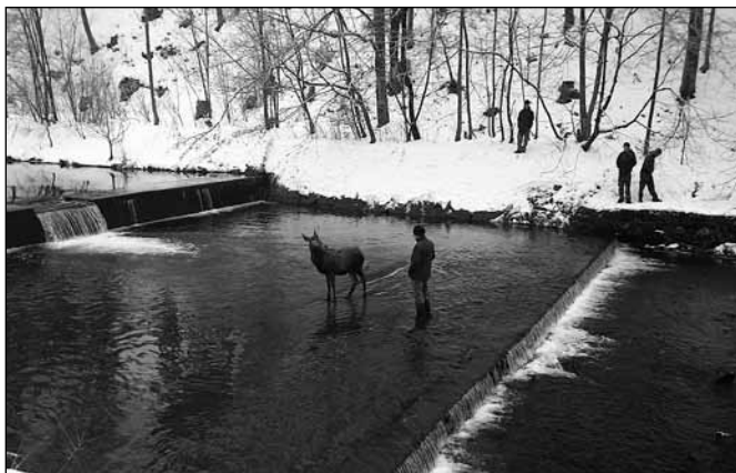
fot. KŁ Głuszec

Pomimo sprzyjających warunków pogodowych od początku tego roku do teraz, według udokumentowanych danych ze Straży Miejskiej w Wiśle oraz Koła Łowieckiego „Głuszec” w Wiśle, tylko na terenie obwodu KŁ „Głuszec” odnotowano 64 padłych saren. Jest to liczba wraz z upadkami zawartymi w ewidencji Komisariatu Policji w Wiśle (17 szt.). Przyjąc jednak trzeba, że liczbę upadków należy przynajmniej podwoić, gdyż jest ona większa o upadki, które nie są udokumentowane, a miały miejsce poza bezpośrednim obszarem zabudowań i dróg.