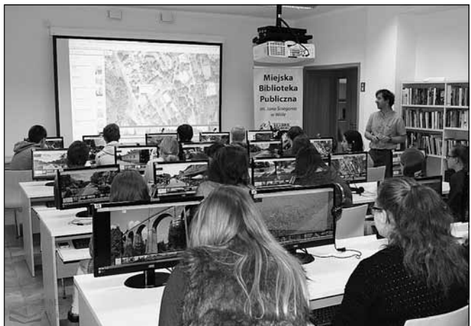
fol. MBP w Wiśle