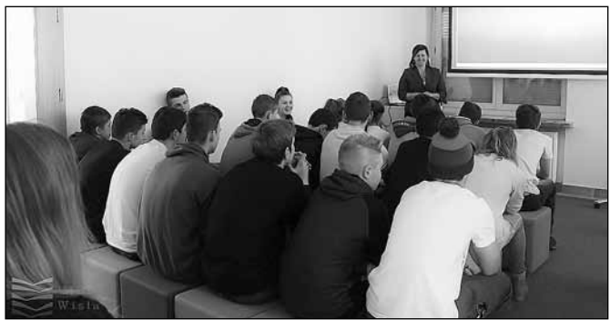
fol. MBP w Wiśle

W dawnej sali kinowej funkcjonuje dziś biblioteka, która organizuje projekcje filmów dokumentalnych i bajek dla dzieci, ale przeszłość kina wymaga zbadania i opracowania. Część dokumentacji udostępnili dawni pracownicy i na jej podstawie w kolejnym numerze „Echa Wisły” ukaże się artykuł Jerzego Kufy o wiślańskim kinie. Wszystkich mogących posłużyć pomocą lub archiwalnymi fotografiami prosimy o kontakt z biblioteką, która zaprasza na kolejne projekcje filmowe. (drc)