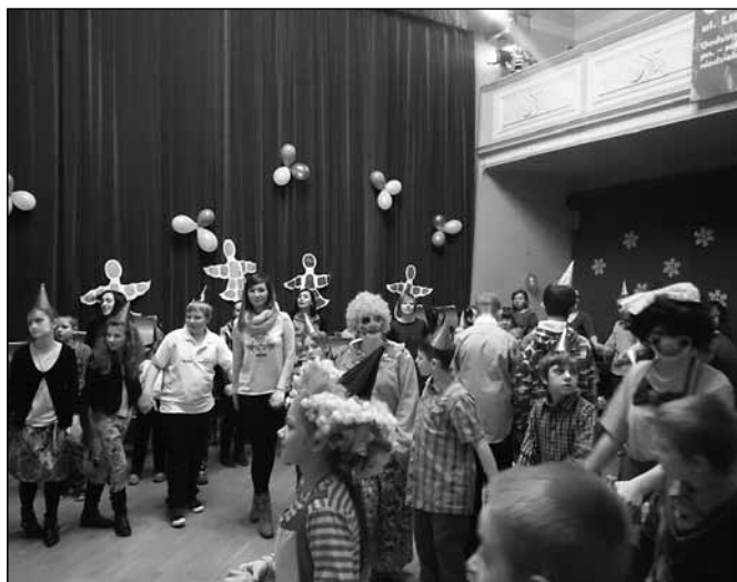
fol. Szkoła Podstawowa nr 5