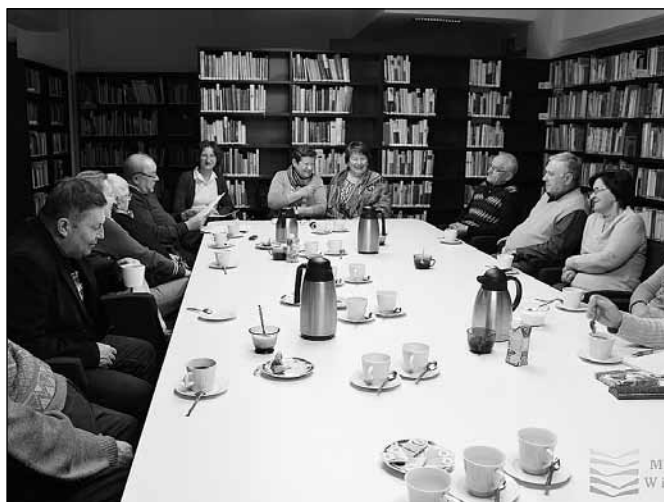
fol. MBP w Wiśle

Dziękujemy wszystkim uczestnikom za miłe spotkania i zapraszamy na kolejne lekcje biblioteczne. Monika Śliwka