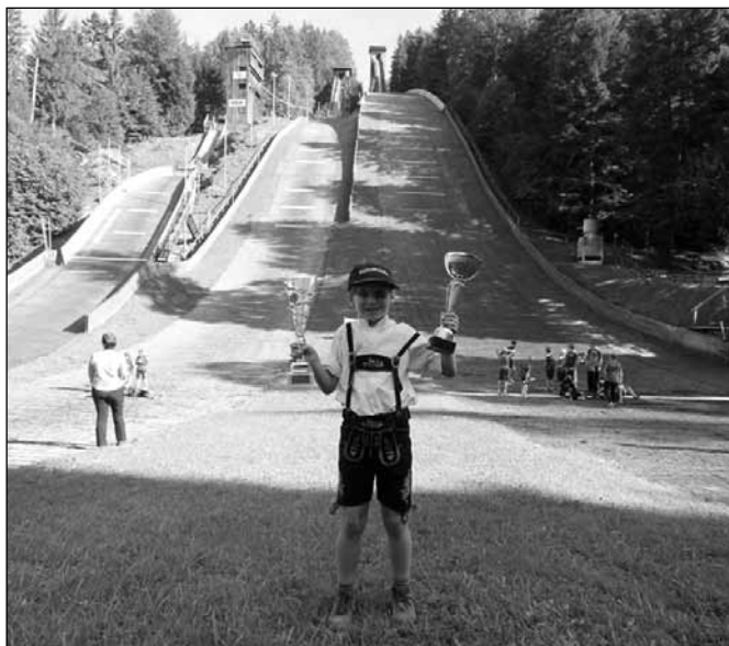
fol. mat. prasowe

Już pierwsze konkursy rozegrane jeszcze w sierpniu w Hinzenbach i Bischofshofen nie pozostawiły wątpliwości, kto w obecnym sezonie będzie królem dziecięcych zawodów. Tymek pewnie w nich wygrywał, gromadząc po 100 punktów za każdy. Kolejny konkurs, który rozegrano 17 września w Ruhpolding dały naszemu skoczko- wi tak ogromną przewagę, że sprawa Pucharu była przesądzona już przed ostatnimi zawodami w Bertchtesgaden. Nie zmieniło to jednak