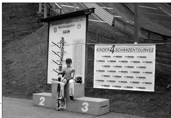
fol. mat. prasowe