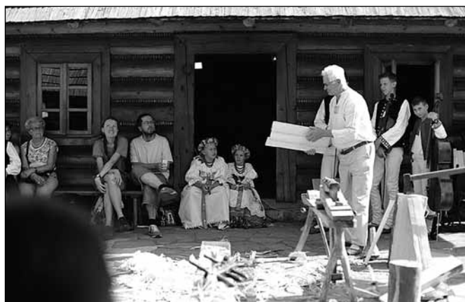
fol. mat. prasowe

Gdy w Enklawie pojawili się nowi adresaci niekończącej się lekcji muzealnej o gongie, tj. grupka Małych Ligocian z Katowic Ligoty w barwnych, pszczyńskich strojach, gdy ruszył ponownie korowód wołoski, przypominający niegdysiejszą kolonizację Wołochów na obecnych ziemiach dzisiejszego Śląska Cieszyńskiego, którzy docierali tu w wiekach XV–XVII z południa Europy, zaszczepiając kulturę pasterską, gdy na wspólnym stole pojawiły się nowe przysmaki, tym razem ze Śląska, z Czarnego, tj. hekele, śląski kołocz z posypką, szkłoki, kopalnioki i ciasteczka tzw. nowej tradycji, tj. piwoszki mamulki, entuzjazm gości, aktywnie uczestniczących w tym wydarzeniu, udzielił się także tym niezdecydowanym zza ogrodzenia obserwującym bawiących się.