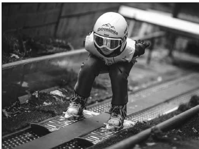
fol. mat. prasowe

Ośmiolatek, mimo młodego wieku, ma na swoim koncie wiele sukcesów. Choć może to wydawać się niemożliwe, jego kariera trwa już cztery lata. Przygodę ze skakaniem na nartach rozpoczął mając zaledwie... cztery lata. Po dwóch tygodniach treningów wziął udział w zawodach, które ukończył na drugim miejscu. Oprócz tego trenuje kombinację norweską, świetnie jeździ na desce snowboardowej i nartach zjazdowych. Jest stałym bywalcem na czerwonych i czarnych trasach w Polsce i za granicą. Na zawodach Lotos Cup stawał w szranki z zawodnikami starszymi od siebie o 4–5 lat.