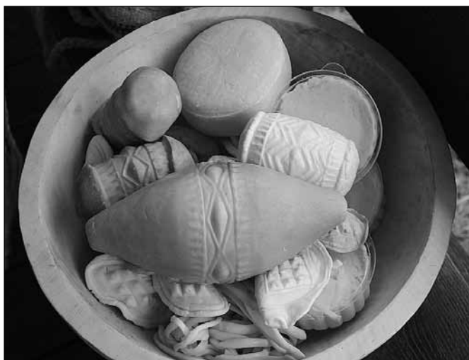
fol. Tadeusz Papierzyński