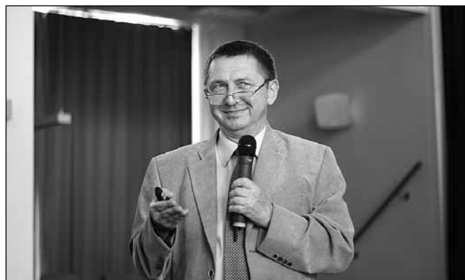
fol. MBP w Wiśle

Wykład i wystawa rozpoczęły tegoroczną edycję Wakacyjnej Akademii Kultury, która odbywa się od 2012 roku. (drc)