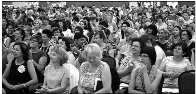
fol. mat. prasowe